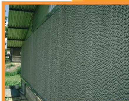
Paneles corridos de diferentes longitudes

Adaptable a cualquier tipo de instalación, en cuanto a formas y dimensiones