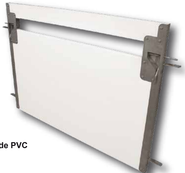
Modelo de PVC