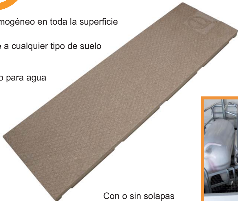
Con o sin solapas